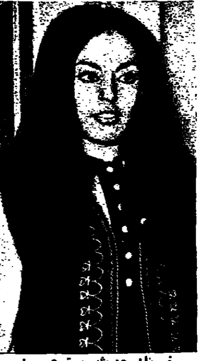
فستان حديث مستوحى من الفولكلور الفلسطيني