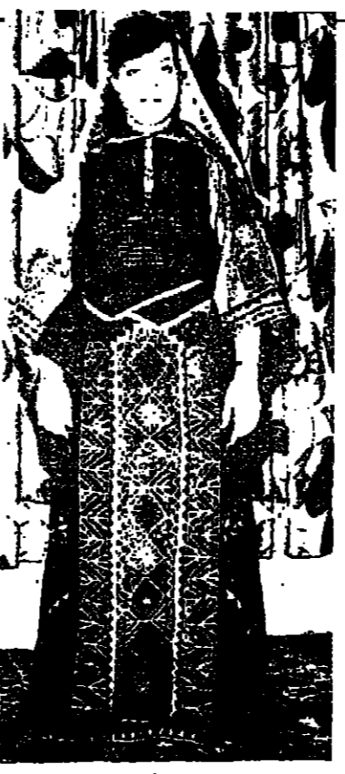
ثوب من بيت لحم