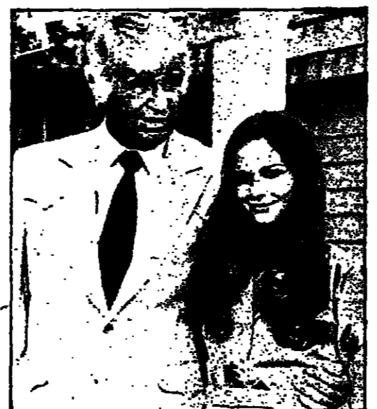
جيم ديفيز (جوك يونغ) وماري كروستي (كريستينا شيرد) في مسلسل دالاس - التلفزيون الإسرائيلي - التاسعة وه ؟ حقيقة