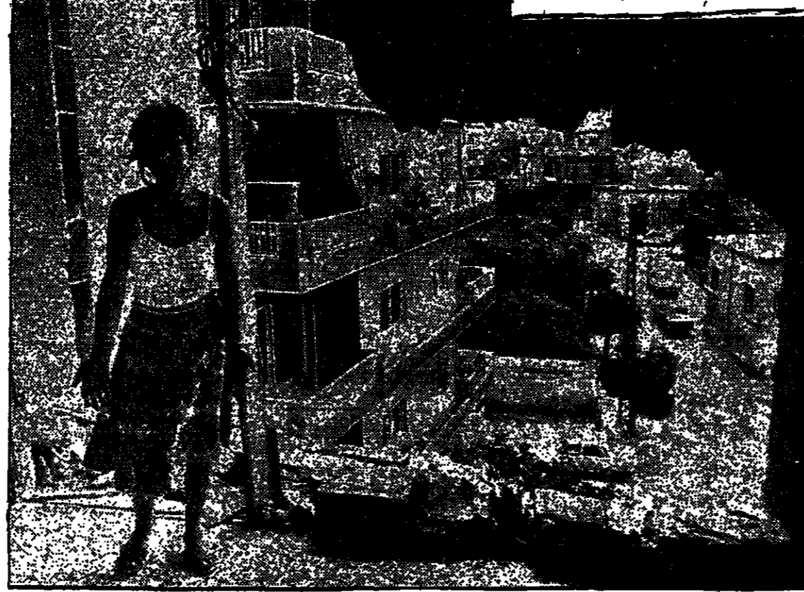
جونيه - تعرضت منطقة شرقي بيروت وجونيه خلال الايام الماضية عدة مرات الى قصف بصواريخ ارض - ارض

مجلس محلي لبيروتية اعلان عن وظيفة شاغرة رقم ٨٢/٣ بموجب المادة ٤١ لمر المجلس المحلية (ادارة بيروت مؤلفين للعمل ١٩٧٦